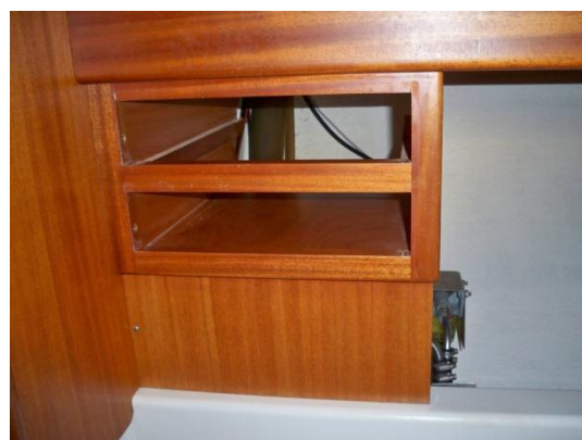
Der er ikke meget plads at arbejde på til at få påfyldningsslangen af. Adgang fra siden var også umulig.