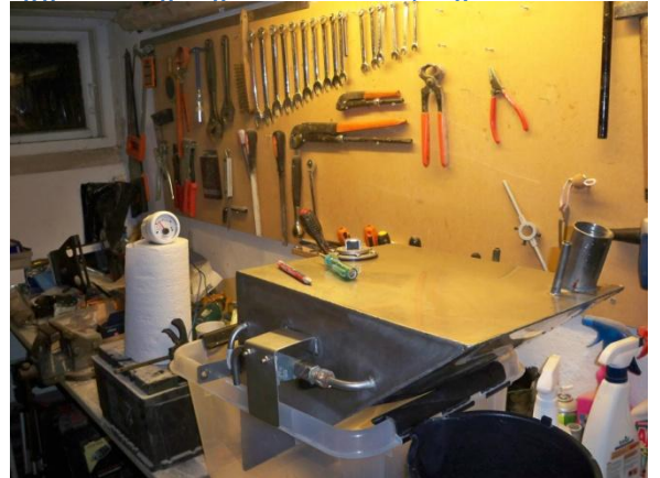
Prøve montering og måling af tank.

Mål nøje op og så er det i gang med borer maskinen. Brug gode bor og langsom fart med smøring.