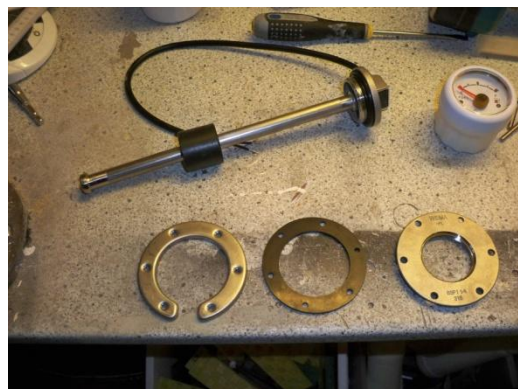
Her ses wema's tank måler. Med en u-bøjle som monteres indvendig i tanken og en flange udvendig som måleren skrues ned i. Måleren er 250 mm lang.

Dernæst placeres den u-formet bøjle inden i tanken, pakning og flange udvendig og det hele skrues sammen. Smør evt lidt flydende pakning over og under gummipakningen. (anbefaling jeg fik, men jeg ved ikke om det er nødvendigt)